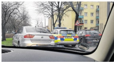
Der K.o. für den Autofahrer: In Bahrenfeld geht plötzlich gar nichts mehr.